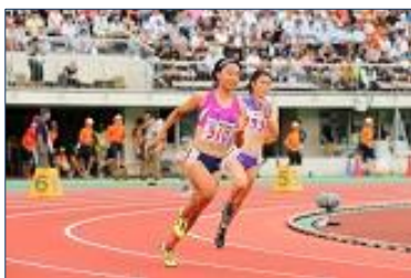
陸上部 全国大会 400m 決勝

陸上部3年生女子が山形県で開催された全国大会で200mは準決勝進出、400mは第8位入賞という成績を残しました。また、1年生女子が第72回大阪総体400mで第5位でした。女子ソフトテニス部は兵庫県で開催された近畿選手権でベスト16、大阪総体で予選ブロック優勝、第32回公立高校大会では準優勝でした。女子硬式テニス部も大阪総体の予選ブロックでシングルス、ダブルスともに優勝しています。サッカー部は大阪総体の3回戦を勝ち上がり、次週4回戦に挑みます。男子バスケットボール部は大阪総体3回戦で惜しくも1点差で涙をのみました。女子バスケットボール部は大阪総体ベスト16まで勝ち上がっています。バレーボール部は3年生男子と女子が地区優秀選手に選出されています。軽音楽部は第38回We are Sneaker Agesにおいて見事優秀校賞を受賞し、12月のグランプリ大会の出場権を3年連続で獲得しました。美術部は2年生女子が大阪府高校美術・工芸展で優秀賞、2年生男子と女子が奨励賞を受賞しました。吹奏楽部は大阪府吹奏楽コンクール南地区大会で優秀校賞を受賞、府大会に3年連続出場を果たし、奨励賞を受賞しました。写真部は大阪川の日コンクールで3年生女子が優秀賞を受賞しています。これら以外にも各大会や発表会、フェスティバルなどで、どのクラブも本当によく頑張ってくれました。