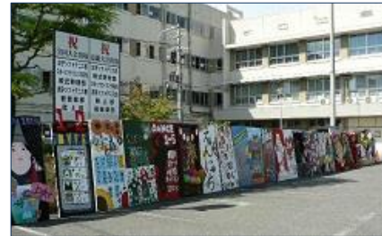
全クラスの立て看板