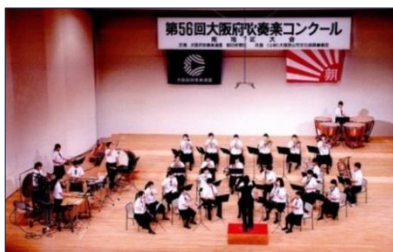
吹奏楽部 南地区大会